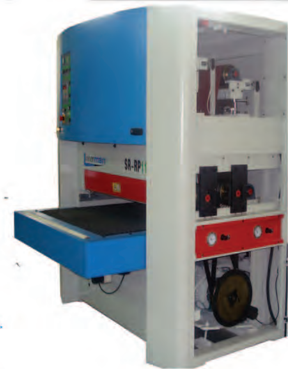
Lijadora 1 motor con diferente velocidad de lijado en 1ª y 2ª banda