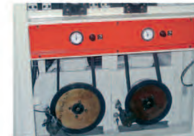
Modelos con dos motores independientes