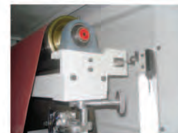
Facil regulacion de la oscilacion