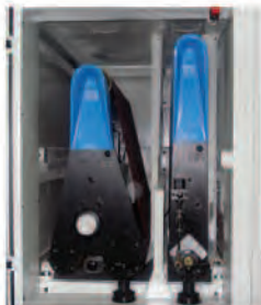
Grupo calibrador y grupo combinado

950 Y 1100 m/m de ancho con 1 motor 1100 y 1300 m/m de ancho con 2 motores