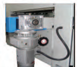
Robusto variador de velocidad